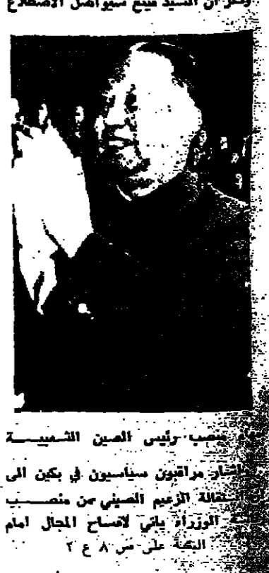
تذكر ان السيد فينغ سيواصل الاستقالة

بيكين - يقدم اليوم الزعيم الصيني هو اكسو فينغ استقالته من منصب رئاسة وزراء بلاده. ونكرت الأنباء الواردة من بيكين ان السيد فينغ سيعان امام مؤتمر الشعب الصيني بالاضافة الى استقالته عن استقالة خمسة من نوابه.